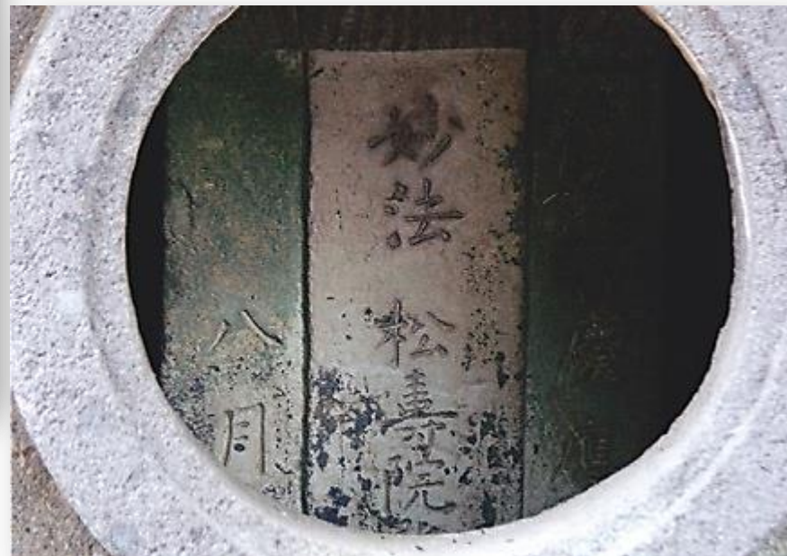
松寿院の墓 西之表市 種子島家お拝塔墓地