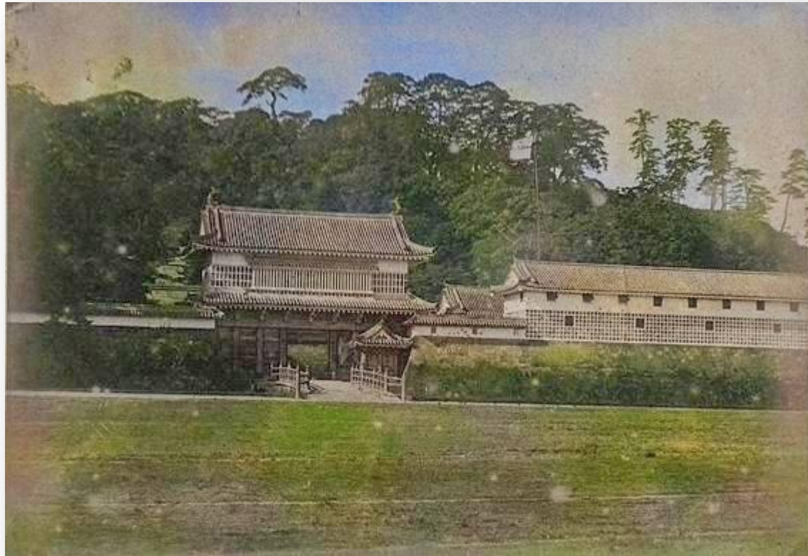
鶴丸城御楼門 (写真着色：鹿児島よかもん再発見)